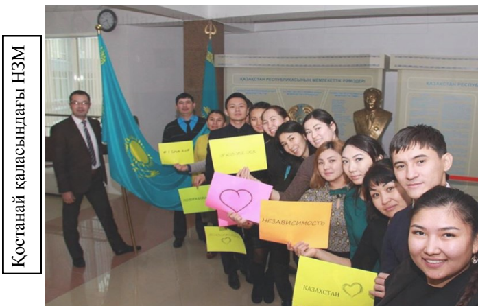
Қостанай қаласындағы НЗМ