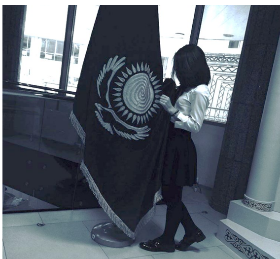
Астана қаласындағы ХБ НЗМ

28 қараша күні мектебіміздің кітапхана үйірмесінің ұйымдастырушылары атаулы мерекеге орай 7-10 сынып оқушылары арасында викторина ойынын өткізді.